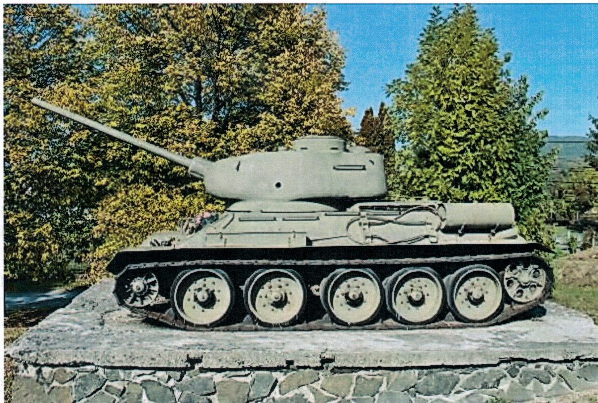
1. Tank stredný T-34/85, prírastkové číslo 1980/00174 S