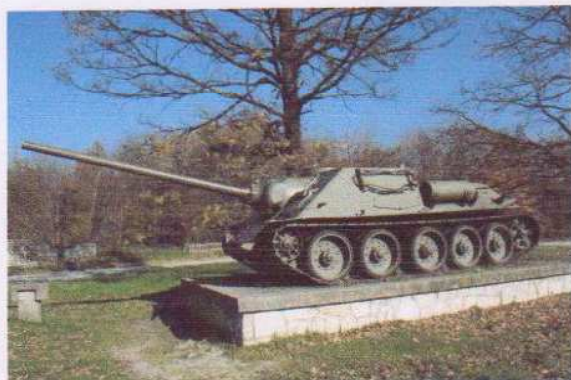
obr. č. 7- samohybné delo SD-100, príř.č. 178/80 - bočný pohľad