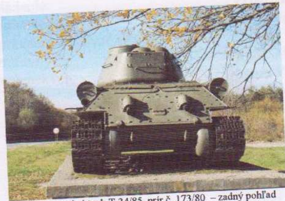
obr. č. 4 – stredný tank T-34/85, prír.č. 173/80 – zadný pohľad