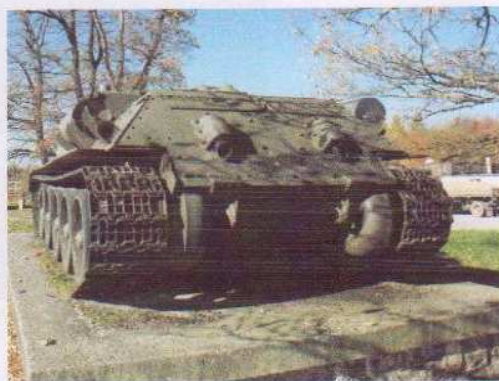
obr. č. 8 - samohybné delo SD-100, príř.č. 178/80- zadný pohľad