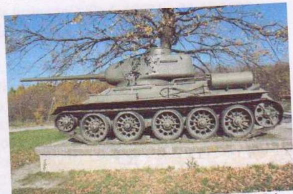
obr. č. 5 – stredný tank T-34/85, prír.č. 173/80 – bočný pohľad