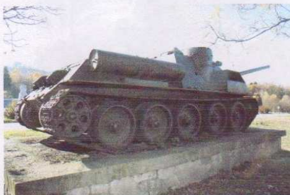
obr. č. 9 - samohybné delo SD-100, príř.č. 178/80- bočný pohľad