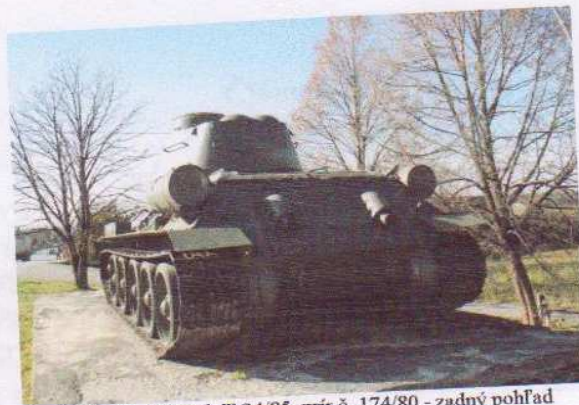
obr. č. 3 – stredný tank T-34/85, prír.č. 174/80 - zadný pohľad