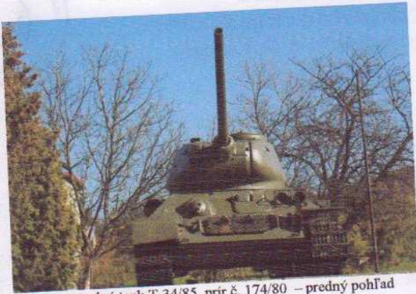
obr. č. 1 – stredný tank T-34/85, prír.č. 174/80 – predný pohľad