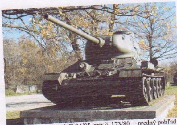
obr. č. 6 – stredný tank T-34/85, prír.č. 173/80 – predný pohľad