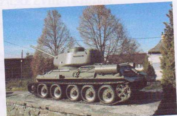
obr. č. 2 – stredný tank T-34/85, prír.č. 174/80 - bočný pohľad